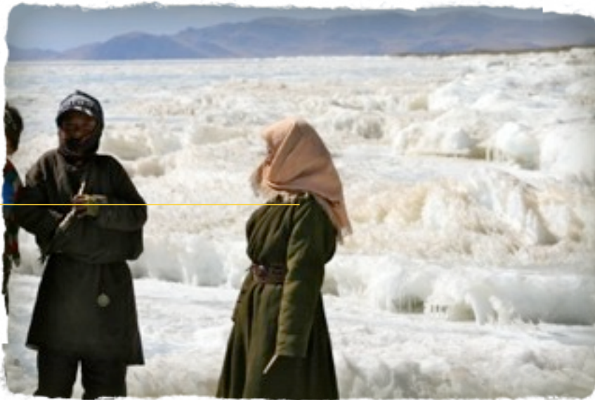
höchster Salzsee der Welt Nam Tso

geschlossen, in den Potala- Palast rutschen wir mit viel Glück noch rein.