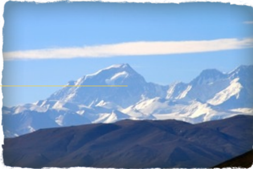
Mount Everest von Norden

dünnere werdende Luft schier den Atem raubt. Der Everest sieht von Norden ganz anders aus als auf Kauf-Fotos, die werden nämlich immer von Nepal aus gemacht, von da ist er hübscher.