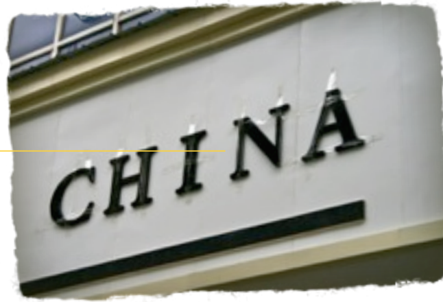
Klebeschild an Bank

Nach 24.175 km und 218 Nächten im Bulli gönnen wir uns spontan in Kathmandu richtigen Luxus: Nicht geplant, sondern spontan in Kathmandu entschieden, gönnen wir uns richtigen Luxus: eine Gruppenreise (individuell geht angeblich nur mit Monaten Planung und Anmeldung) nach Tibet. Über Land nach Lhasa und mit dem Flieger zurück. Basis-Komfort, bei der Buchung werden wir auf schreckliche Unterkünfte vorbereitet. Alles wird anders.... Nach 5-stündiger Busfahrt bergauf erreichen wir die Grenze nach China. Schlicht auf nepalischer Seite, pompös nach der Grenzbrücke mit ersten chinesischen Paradesoldaten- jedes Mienenspiel vermeidend.